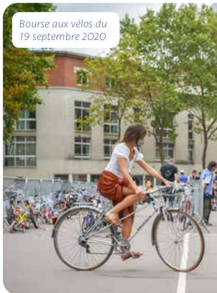
Bourse aux vélos du 19 septembre 2020