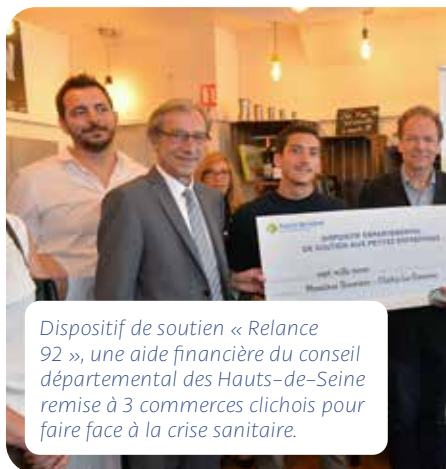
Dispositif de soutien « Relance 92 », une aide financière du conseil départemental des Hauts-de-Seine remise à 3 commerces clicheois pour faire face à la crise sanitaire.