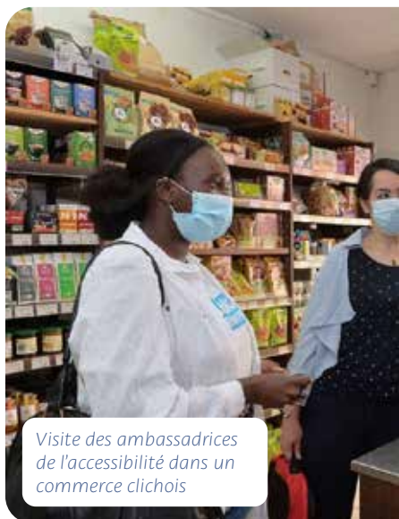
Visite des ambassadrices de l'accessibilité dans un commerce clichois