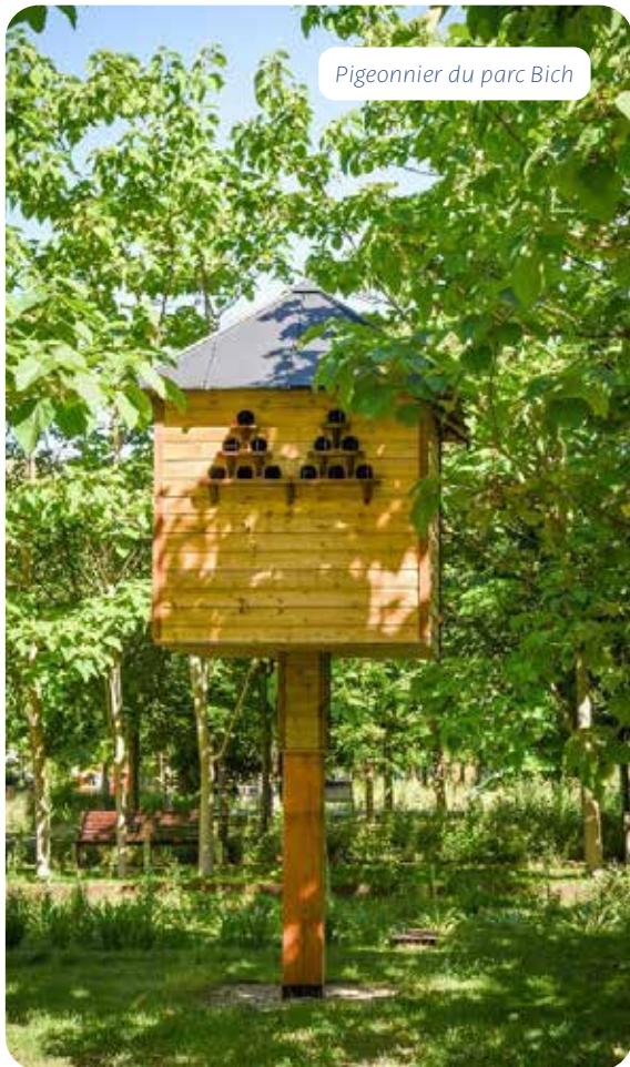
Pigeonnier du parc Bich