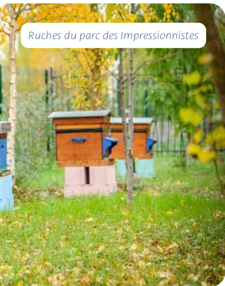
Ruches du parc des Impressionnistes