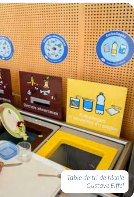
Table de tri de l'école Gustave Eiffel

9,6 tonnes de biodéchets collectés et valorisés