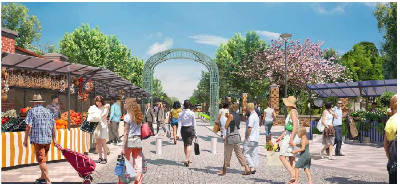
Vue 3 - Entrée côté du boulevard du Général Leclerc