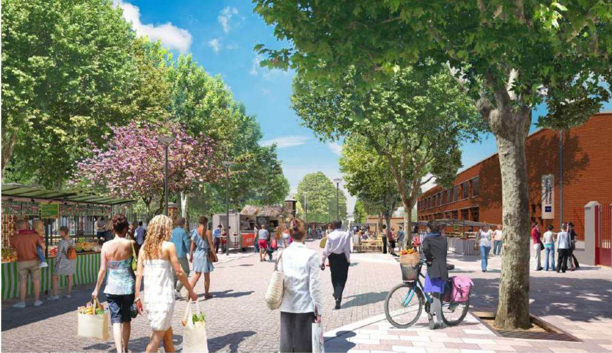
Vue 2 - Centre du marché