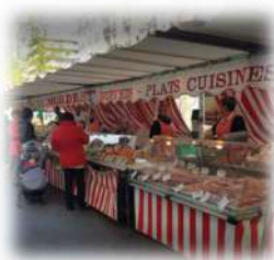
Illustrations de principe