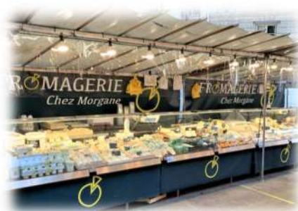
Illustrations de principe